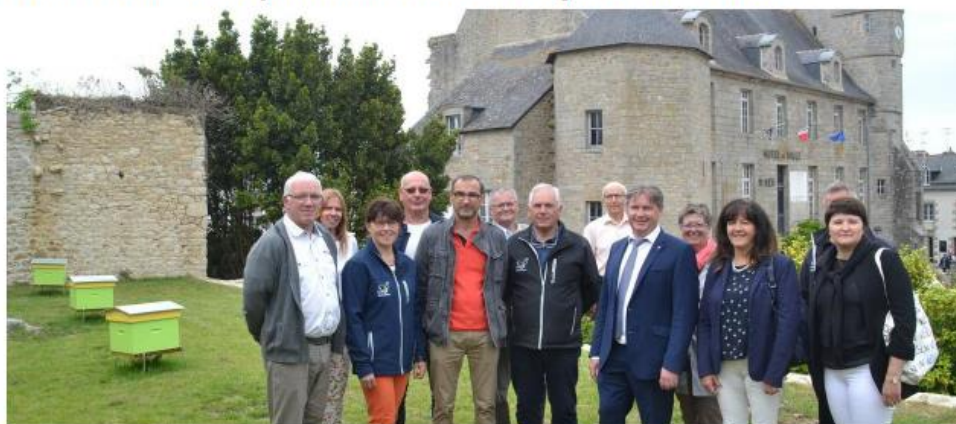
Elus et représentants de l'Abesselle finistérienne dans le jardin des Douves. Cadre exceptionnel, pour les 3 ruches installées face à l'Hôtel de ville, et la possibilité pour les abeilles de butiner à proximité de nombreuses essences florales