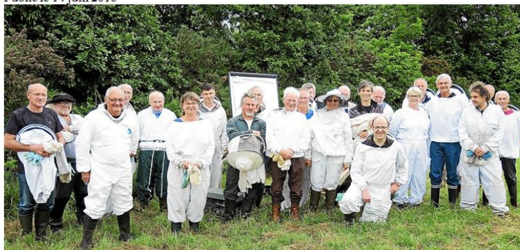
Une trentaine d'apiculteurs s'est retrouvée samedi après-midi au rucher pédagogique de Coat Morn, l'occasion pour chacun de partager son expérience et d'affiner sa technique.