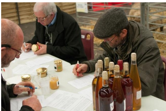
Les résultats du concours 2016 : MIEL & CHOUCHEN

Le jury n'a donc pas chômé pour établir le palmarès !