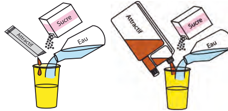
Recharge individuelle ou Bidon d'un litre